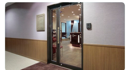
まるでホテルラウンジのような雰囲気、でクラス感溢れるクリニック