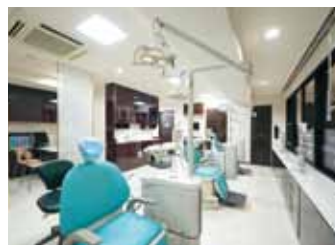
スワロフスキーが散りばめられたハイクラスな空間には、最新の医療機器、医療材料が勢揃い