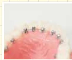
●リンガルブラケット (裏側からの矯正法)…95万円～

ブラケットを歯の裏側に装着するので、表から全く見えないのが魅力。装置だけでもクリッピー、Stb、インコグニート、エポリューション、カーツ7thと5種類あり、症状に合わせて最適なものを選んでくれます。話にくい、食事がしづらい、舌があたって痛いといった不快感もクリア。目立たない装置で、傷みが少ない、いいこと尽くしの矯正治療法です。