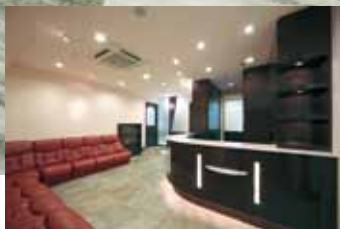
大理石が敷き詰められた院内は、ホテルラウンジのような雰囲気