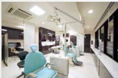
最新の医療機器、医療材料が揃う院内。カウンセリングルームも完備しています