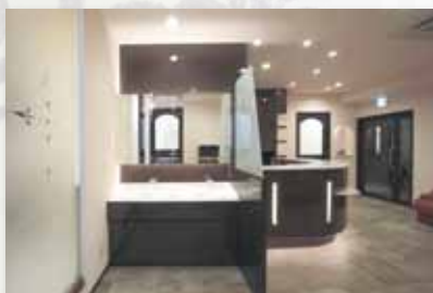
ブラッシングコーナーも仕切りを付けてプライバシーを確保