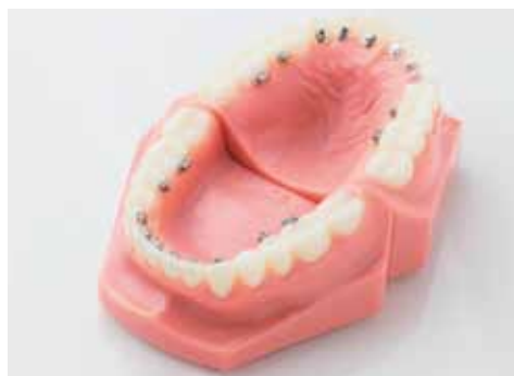
従来より一回り小さくなった、「リングブラケット」の矯正装置。食事や発音の際のストレスがなくなり、歯磨きもしやすい。負担の少ない弱い力で歯を動かすため、治療スパンが短く、通院回数も減った