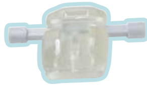
矯正装置の模型。カウンセリングのときこれを使いわかりやすく説明する。