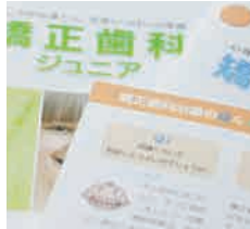
大山医院のパンフレットには、詳しく わかりやすい矯正に関するQ&A も入っている。