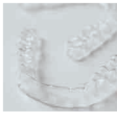
マウスピース型矯正装置「インザピライン」。透明で目立たず、外し たいときに外せる。

年齢に関係なく矯正治療を可能にする手法。 実は矯正歯科の学会内で、 '90年代後半にパラダイムシフトとなるほど 画期的な進歩があったという。